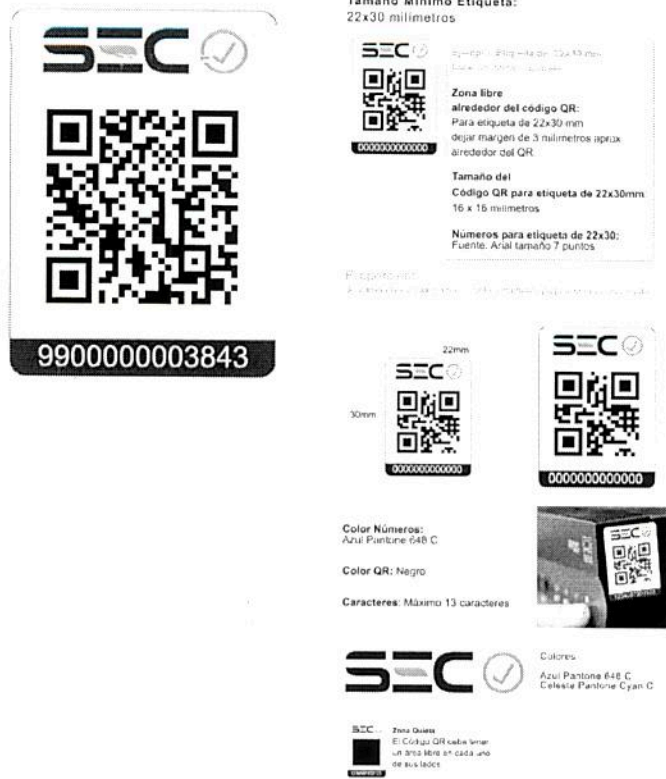
Sello Ejemplo 1: